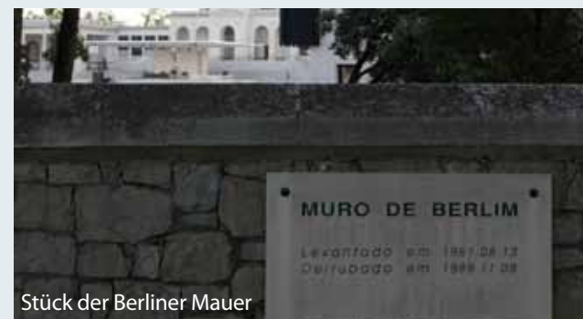
Stück der Berliner Mauer