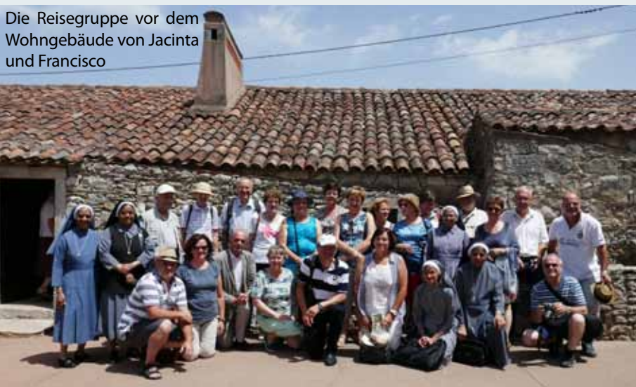
Die Reisegruppe vor dem Wohngebäude von Jacinta und Francisco

Wie groß die Sehnsucht nach Frieden nach dem Zweiten Weltkrieg bei uns in Österreich war, zeigt auch die Baugeschichte unserer Kirche in Münzgraben, die eine Fatimakapelle beherbergt und auch das entsprechende Patrozinium, also den Weihetitel - ausgehend von der Botschaft von Fatima - trägt. Nachdem unsere ehemalige Annakirche am Allerheiligentag 1944 durch Bomben zerstört worden war, wurde die neu errichtete Kirche am Allerheiligentag 1960 „Zum unbefleckten Herzen Marias“ geweiht.