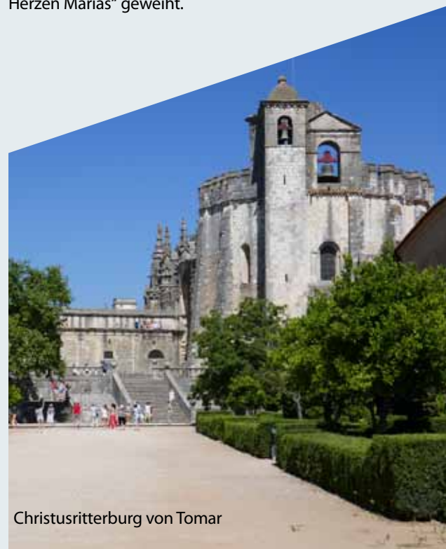
Christusritterburg von Tomar